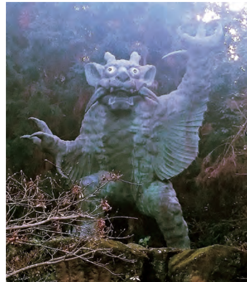
82番 根香寺 牛鬼伝説の牛鬼像