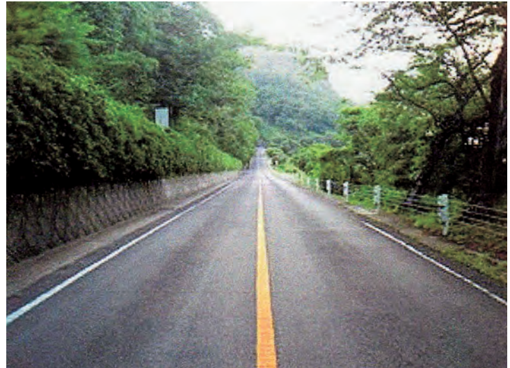
中腹近くにあるミステリーゾーン。現地に立つと奥に下っているように見えるが、実際は上っている。

その後は、愛媛・高知と泊りが必要なところになるので一休みとなるかも分かりません。